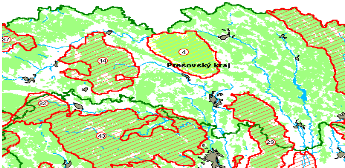
Obrázok 3 Mapa CHVÚ Čergov

Územie európskeho významu Čergov – rozloha 6063,43 ha. V ÚEV Čergov sú predmetom ochrany biotopy a chránené druhy.